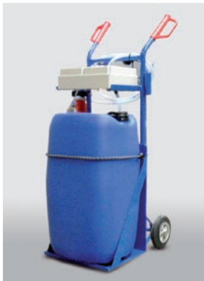
Wózek z zasobnikiem wody dostępny w wersji zasilanej prądem przemianym lub stałym