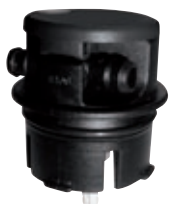
System centralnego napełniania