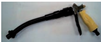
Pistolet napełniający (T.Gun Filler)